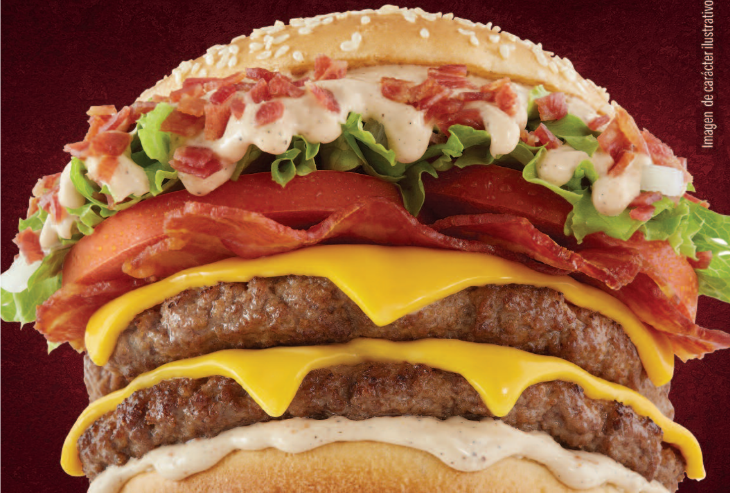
Imagen de carácter ilustrativo.